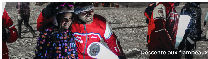
Descente aux flambeaux

PROGRAMME DES ANIMATIONS | SAINT JEAN D'ARVES - LES SYBELLES