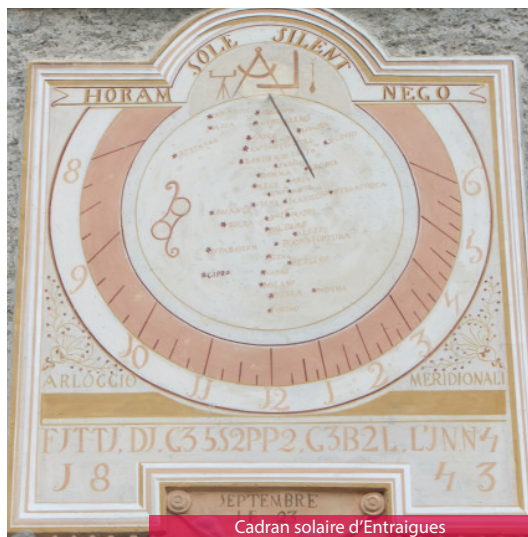
Cadran solaire d'Entraigues