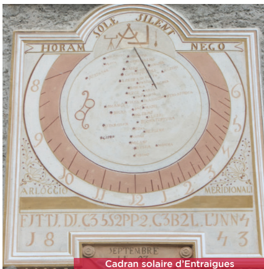
Cadran solaire d'Entraigues