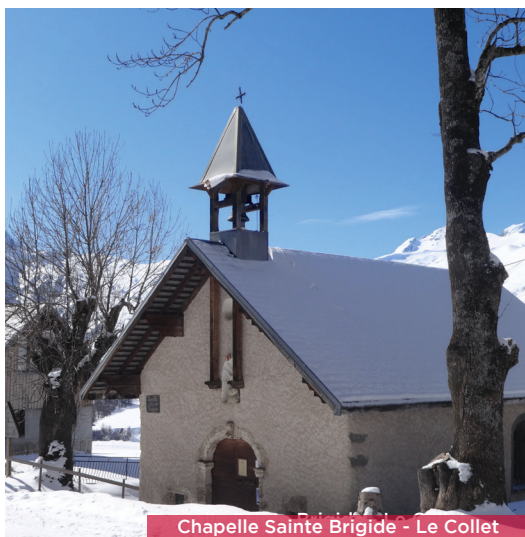
Chapelle Sainte Brigide - Le Collet