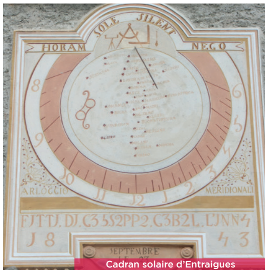
Cadran solaire d'Entraigues